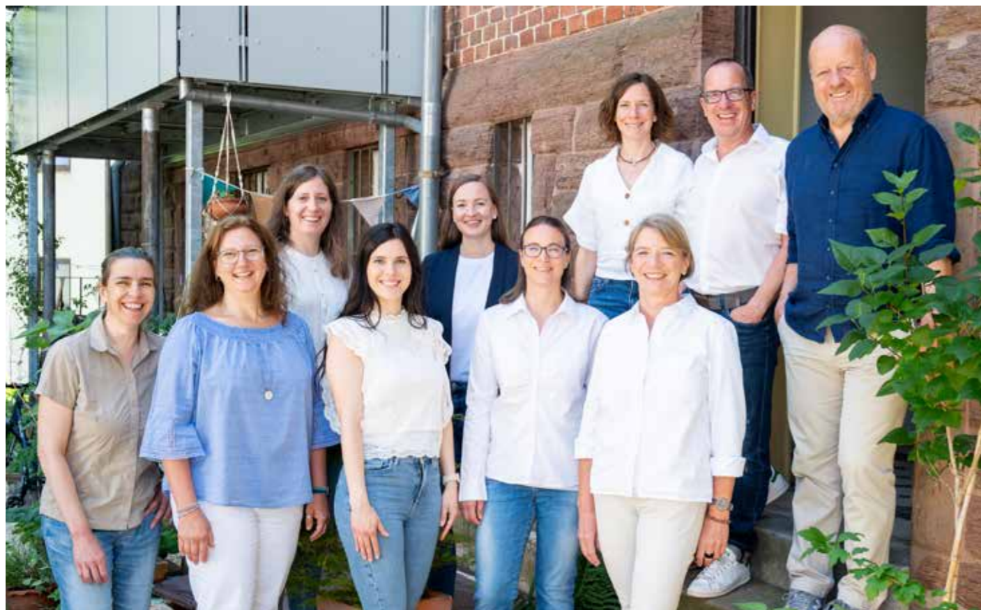
Der Vorstand und das Team der Geschäftsstelle – Gemeinsam sind wir für Sie ein starkes Team!